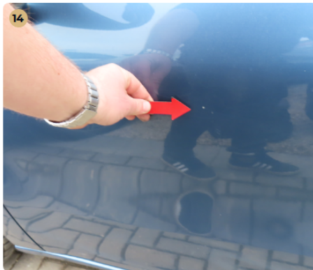
14 Külső karosszéria elemek Az autó használatából eredő apró kavicsfelverődések, hajszál karcok láthatóak. A karosszérián használatból eredő fénysérülések, karcok vannak.