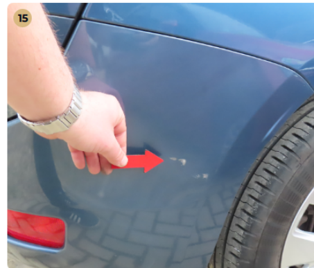
15 Külső karosszéria elemek Az autó használatából eredő apró kavicsfelverődések, hajszál karcok láthatóak. hátsó vészfékhorzsolts.