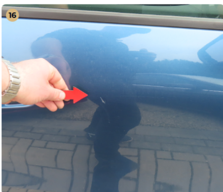
16 Külső karosszéria elemek Jobb első ajtón fénysérülés van.