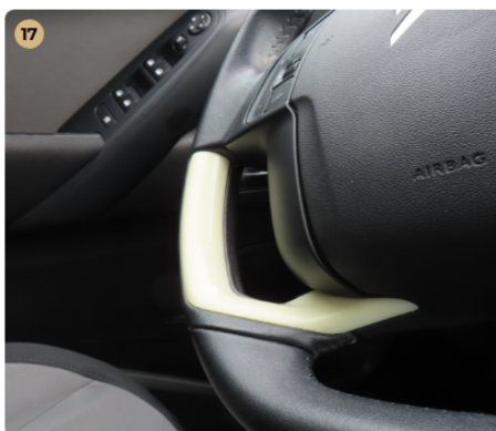
17 Kárpitozás és belső burkolatok A kormánykerék kopott.