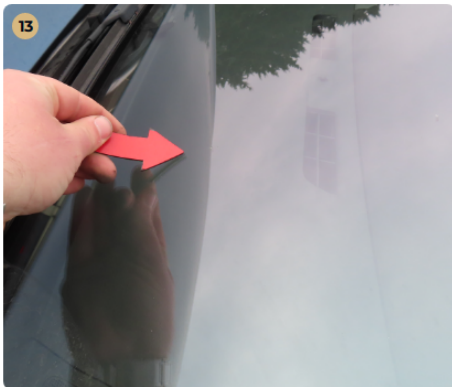
13 Szélvédők, üvegek Az első szélvédőn látható sérülés van. 2-3 kavics sérülés.