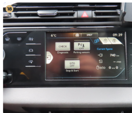
18 Elektromos berendezések Műszerfalfények megfelelően működnek.