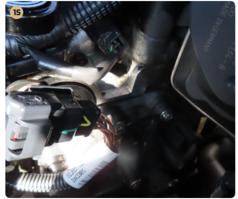
15 Motor Motortérben régebbi olajsár fedezhető fel.