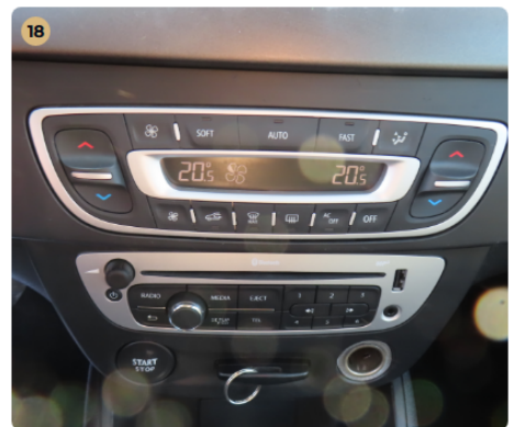
18 Elektromos berendezések Műszerfalfények megfelelően működnek.