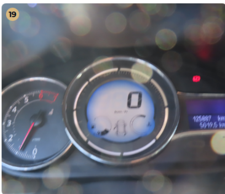
19 Hibakód kiolvasása Számítógépes kiolvasás során nem találtam hibát.