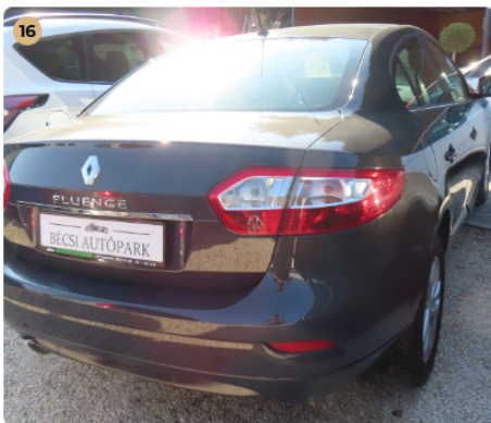
16 Szélvédők, üvegek Hátsó szélvédőn látható sérülés nincs.