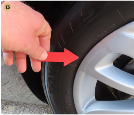
13 Felnik Könnyűfém felnin patkázás nyomai láthatóak. Enyhe karcolások.