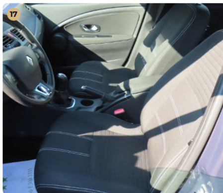
17 Kárpitozás és belső burkolatok A bőr/alcantara kifogástalan állapotú.