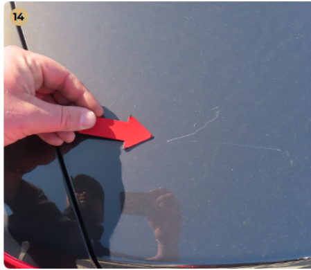
14 Külső karosszéria elemek Az autó használatából eredő apró kavicsfelverődések, hajszal karcok láthatóak. csomagtér ajtó