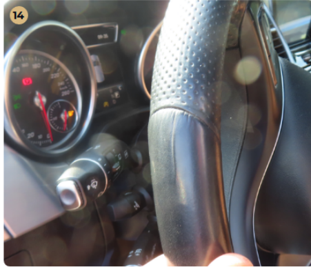
! Kárpitozás és belső burkolatok Kormány enyhén karcos.