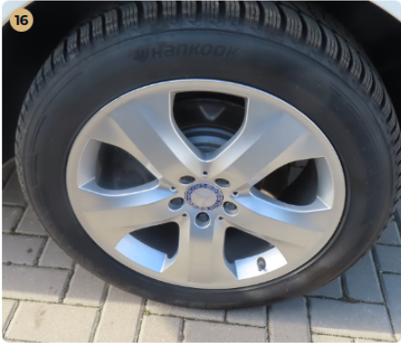
✓ Felnik Könnyűfém felni gyári.