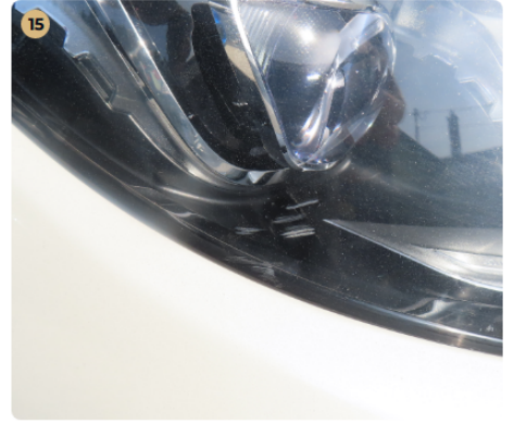
! Világítás Jobb első fényszóró kicsit karcos.