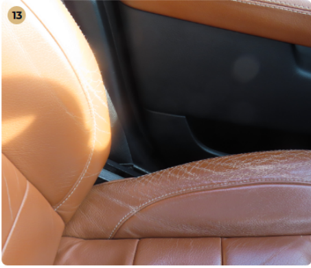
! Kárpitozás és belső burkolatok Vezető oldali ülés oldaltámasza kopott.