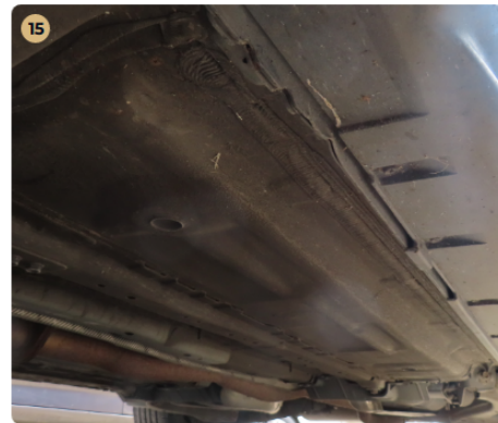
✓ Utasegély és gyűrődő zónák A küszöbökön javításra utaló nyomok nem észlelhetők.