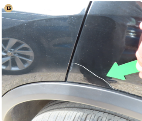
! Külső karosszéria elemek Bal hátsó sárvédőn nagyobb karc.