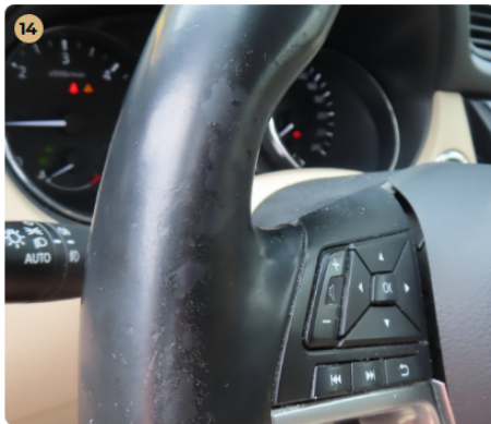
! Kárpitozás és belső burkolatok A kormánykerék kopott.