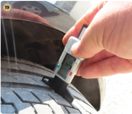
✓ Gumiabroncsok A gumiabroncsok profil mélysége megfelelő.