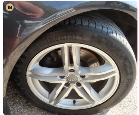
✓ Gumiabroncsok A gumiabroncsok odalfala nem repedett.