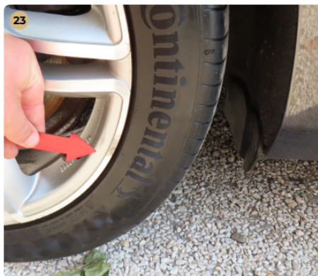
⚠ Felnik Felniken 1-2 apró sérülés látható, de összességében szép állapotban vannak.