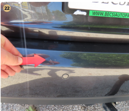
⚠ Külső karosszéria elemek Az autó használatából eredő apró kavicsfelverődések, hajszál karcok láthatóak. Hátsó vészárítón 1-2 apró karc, fénysérülés van.