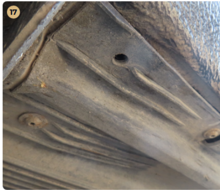
✓ Utascella és gyűrődő zónák A küszöbökön javításra utaló nyomok nem észlelhetők.