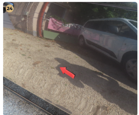
⚠ Külső karosszéria elemek Az autó használatából eredő apró kavicsfelverődések, hajszál karcok láthatóak. Bal hátsó ajtón apró ajtó rányitás, kisebb horpadás van.