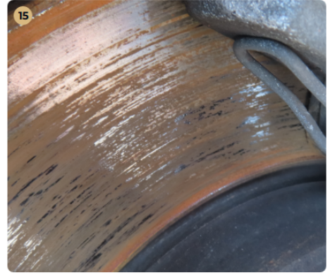
✓ Féktárcsán Féktárcsán állásból adódóan felületi korrózió látható, ami rövid használat után lekopik. Első féktárcsáknak enyhe válla van.