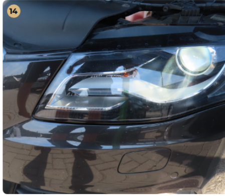
✓ Világítás Az első fényszórók nincsenek bemattulva.