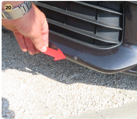
⚠ Külső karosszéria elemek Az autó használatából eredő apró kavicsfelverődések, hajszál karcok láthatóak. Apró kavics sérülések és fénysérülések az első vészárítón.