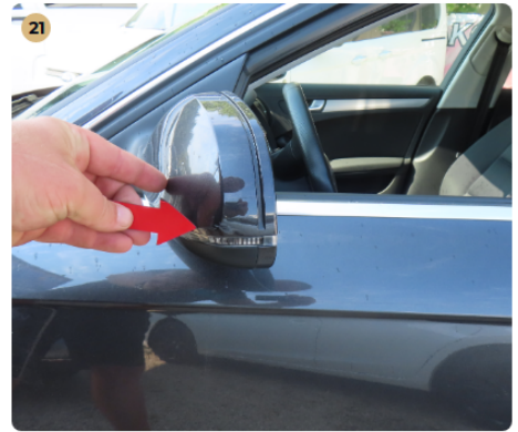
⚠ Külső karosszéria elemek Bal első visszapillantó tükör burkolaton apró horzsolás.