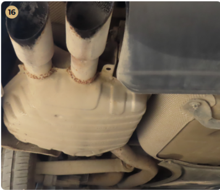
✓ Motor A kipufogórendszer és a dobok állapota megfelelő.