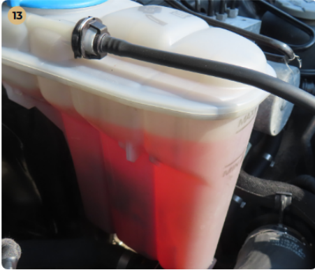
✓ Motor A hűtőfolyadék szintje megfelelő.