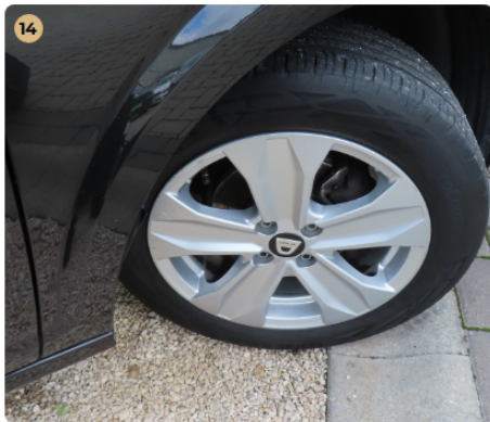
⚠ Felnik Könnyűfém felnin patkázás nyomai láthatóak.