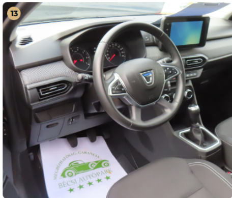
✓ Kárpitozás és belső burkolatok Műszerfal normál állapotú.