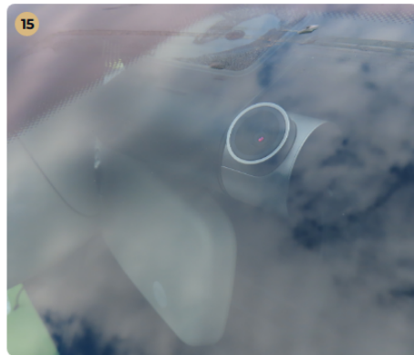
⚠ Szélvédők, üvegek Az első szélvédőn látható sérülés nincs.