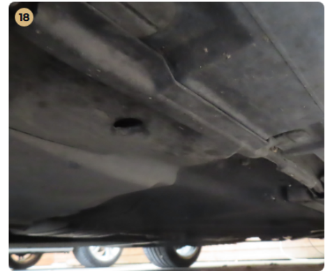
✓ Utascella és gyűrődő zónák A küszöbökön javításra utaló nyomok nem észlelhetők.