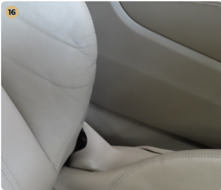
! Kárpitozás és belső burkolatok Vezető oldali ülés enyhén kopott.