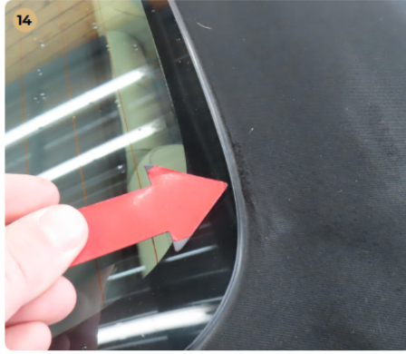
! Kárpitozás és belső burkolatok Szövet tetőn minimális kopás látható.