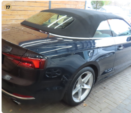
✓ Szélvédők, üvegek Hátsó szélvédőn látható sérülés nincs.