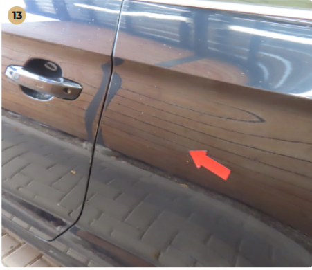
! Külső karosszéria elemek Az autó használatából eredő apró kavicsfelverődések, hajsza karcok láthatóak.