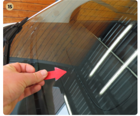
⚠ Szélvédők, üvegek Első szélvédőn 1-2 apró kavics sérülés van.