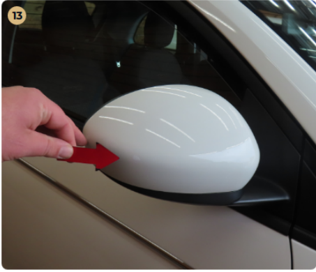
⚠ Külső karosszéria elemek Az autó használatából eredő apró kavicsfelverődések, hajszaál karcok láthatóak.