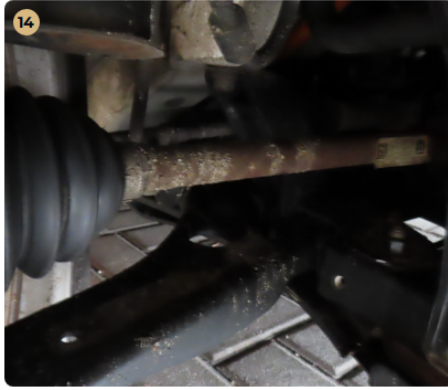
✓ Futómű A gumiharangokon szakadás, repedés nem látható.