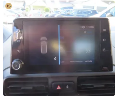
✓ Elektromos berendezések Műszerfalfények megfelelően működnek.