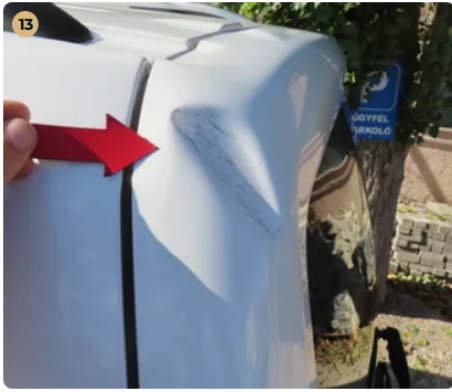
⚠ Külső karosszéria elemek