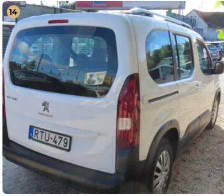
✓ Szélvédők, üvegek Hátsó szélvédőn látható sérülés nincs.